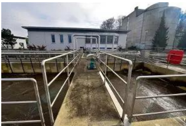
Abwasserreinigungsanlage in Wanzwil

Aufgrund veralteter Infrastruktur und sich verschärfenden Gewässerschutzvorschriften ist eine umfassende Sanierung und ein Weiterausbau des Netzes sowie der Kläranlagen notwendig; wobei die ARA Herzogenbuchsee am heutigen Standort in Wanzwil mittelfristig wegen zu geringer Kapazität - verbunden mit einer ungenügenden Wirtschaftlichkeit - gemäss den Vorgaben aus dem kantonalen Richtplan in rund 15 Jahren an eine grössere Anlage angeschlossen werden muss.