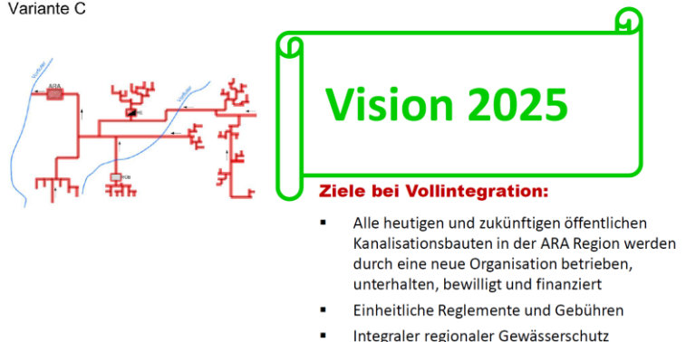
Abb. 2: Variante C = Abwassergemeinde - Vollintegration mit Übertragung aller Anlagen an den Gemeindeverband ARA

Der Zweck des Verbandes wurde 2024 erweitert und neu zwei Kategorien von Verbandsgemeinden geschaffen: